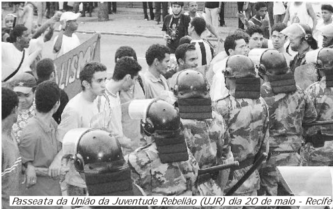
Passeata da União da Juventude Rebelião (UJR) dia 20 de maio - Recife

Esse objetivo supremo ainda não foi alcançado. Mas a luta continua e continuará sempre até a vitória final. Cabe a nós, estudantes de hoje, recolocar a UNE no caminho das lutas e novamente ao lado dos estudantes brasileiros. Por isso, defendemos que o 49º Congresso da UNE aprove a realização das eleições diretas para a diretoria da UNE e uma pauta de reivindicações que defenda o ensino público e gratuito, mais verbas para a educação e profundas transforma-