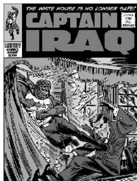
Latuff: arte a serviço da resistência

Carlos Latuff é um artista popular do Brasil. Rebelde, dedica sua arte a prestar solidariedade aos movimentos antiimperialistas e antifascistas do país e de diferentes partes do mundo.