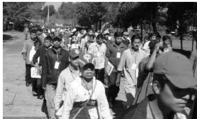
Passeata no México, Eijaa/2004