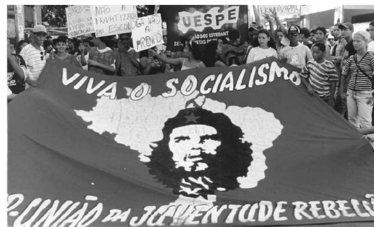
Juventude na luta por seus direitos e pelo socialismo