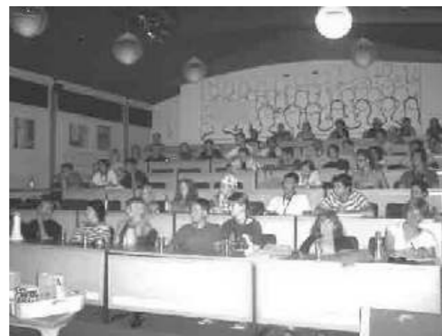
Debate durante o Eijaa/2006 na Dinamarca

O Comitê Preparatório Nacional espera a presença de mais de 1.000 jovens vindos de 30 países diferentes.