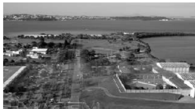
Faculdade de Educação Física, local do Eijaa/2008

O encontro acontecerá no Campus do Fundão da Universidade Federal do Rio Janeiro, mais precisamente na Faculdade de Educação Física.